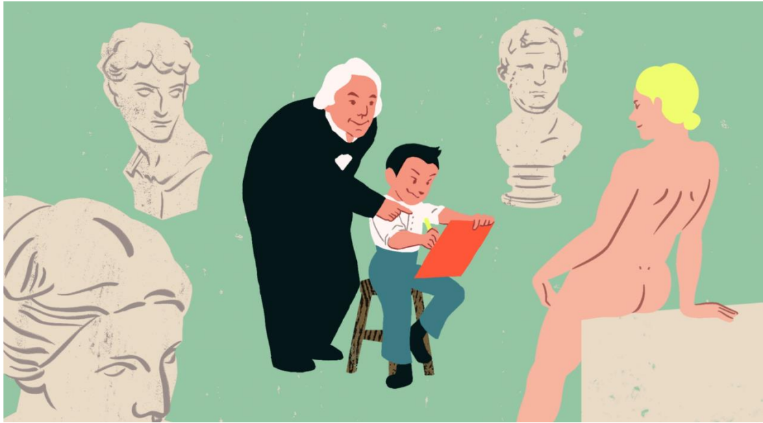
【圖四】： 羅丹的老師波瓦柏丹 ( Horace Lecoq de Boisbaudran ) 教會了他如何從記憶中捕捉生命的每一個微妙動作，羅丹專注地觀察每個細節，不斷精進自己的技能。