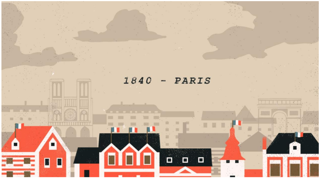
【圖二】： 1840年羅丹誕生於巴黎一個普通的家庭。